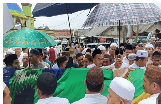
Gambar 3. Ketika habis di